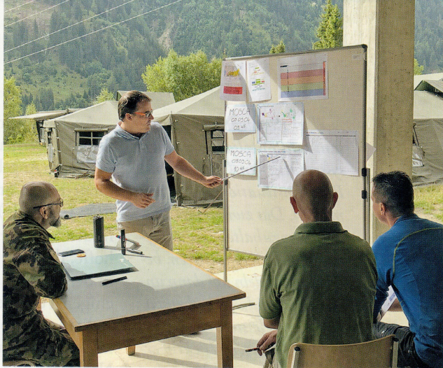
Stabsarbeit heisst auch: Präsentieren von Resultaten.

Der Kurs folgt einem etablierten Modell: Durch praktische Übungen lernen und militärische Entscheidungsprozesse anwenden. Am ersten Tag wird mit Hilfe eines Krisenszenarios, das durch die Schliessung einer wichtigen Verkehrsachse unseres Landes verursacht wird, das Wissen über die ersten drei Phasen der 5+2 Methode (Problemerkennung, Beurteilung der Lage, Entschlussfassung) ver-